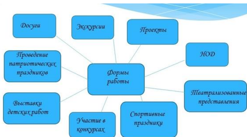
Рис. 1 Формы работы по патриотическому воспитанию в ДОУ.

В младшем дошкольном возрасте проводится работа над воспитанием любви к своей семье, к детскому саду. Проводятся тематические мероприятия к праздникам День матери, День отца, 8 Марта и т.д.